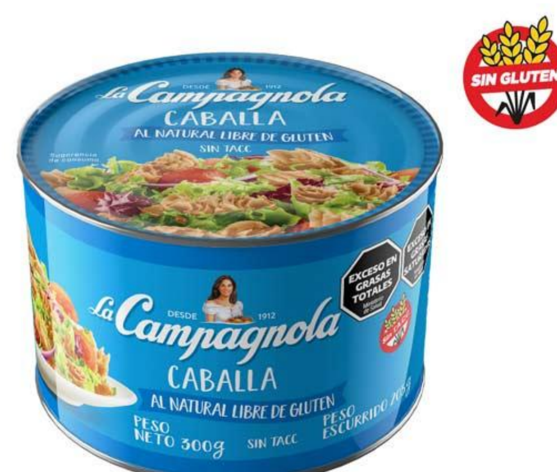
Caballa al Natural LA CAMPAGNOLA 300 grs