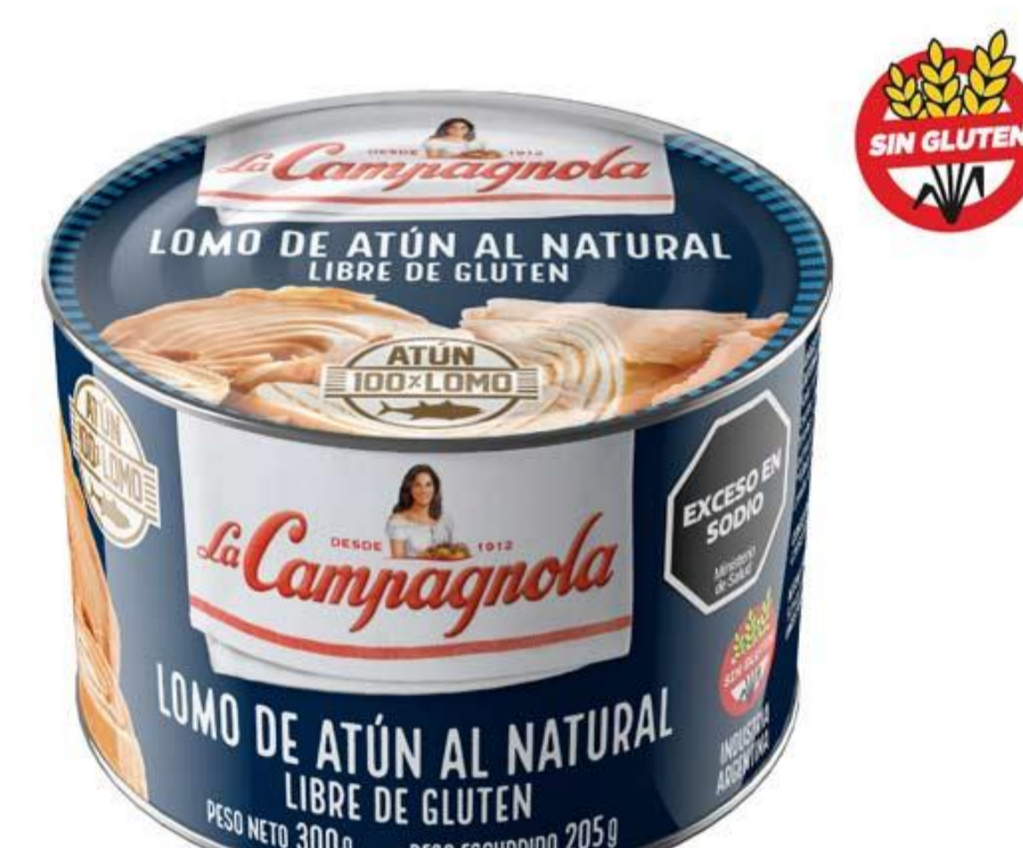
Lomo de Atún al Natural LA CAMPAGNOLA 300 grs