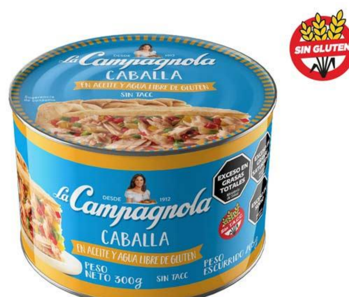
Caballa en Aceite y Agua LA CAMPAGNOLA 300 grs