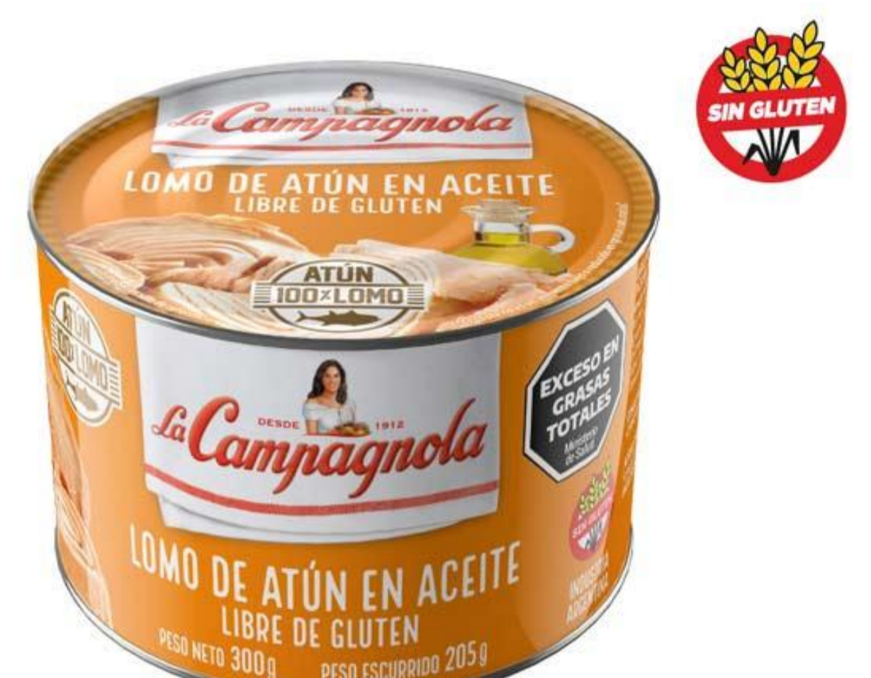
Lomo de Atún en Aceite LA CAMPAGNOLA 300 grs