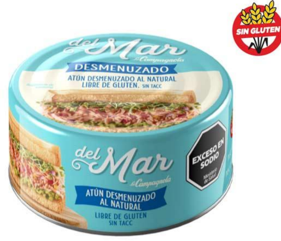
Atún Desmenuzado Natural DEL MAR 170 grs

1012995 ATUN.DESMEN. NATURAL.LC. 24X170G