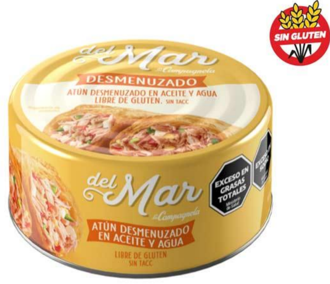
Atún Desmenuzado en Aceite DEL MAR 170 grs

1012994 ATUN.DESMEN. ACE/AG.LC. 24X170GR