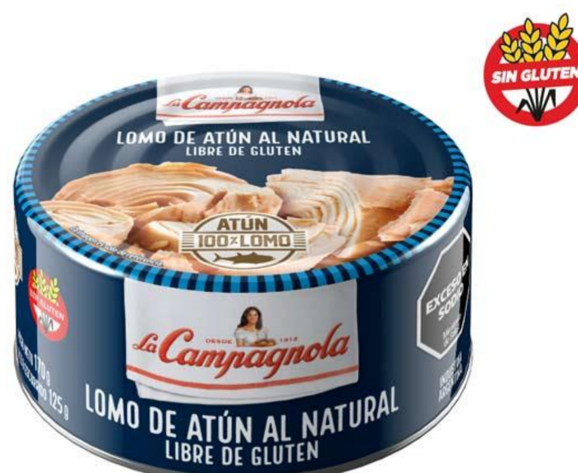
Lomo de Atún al Natural LA CAMPAGNOLA 170 grs