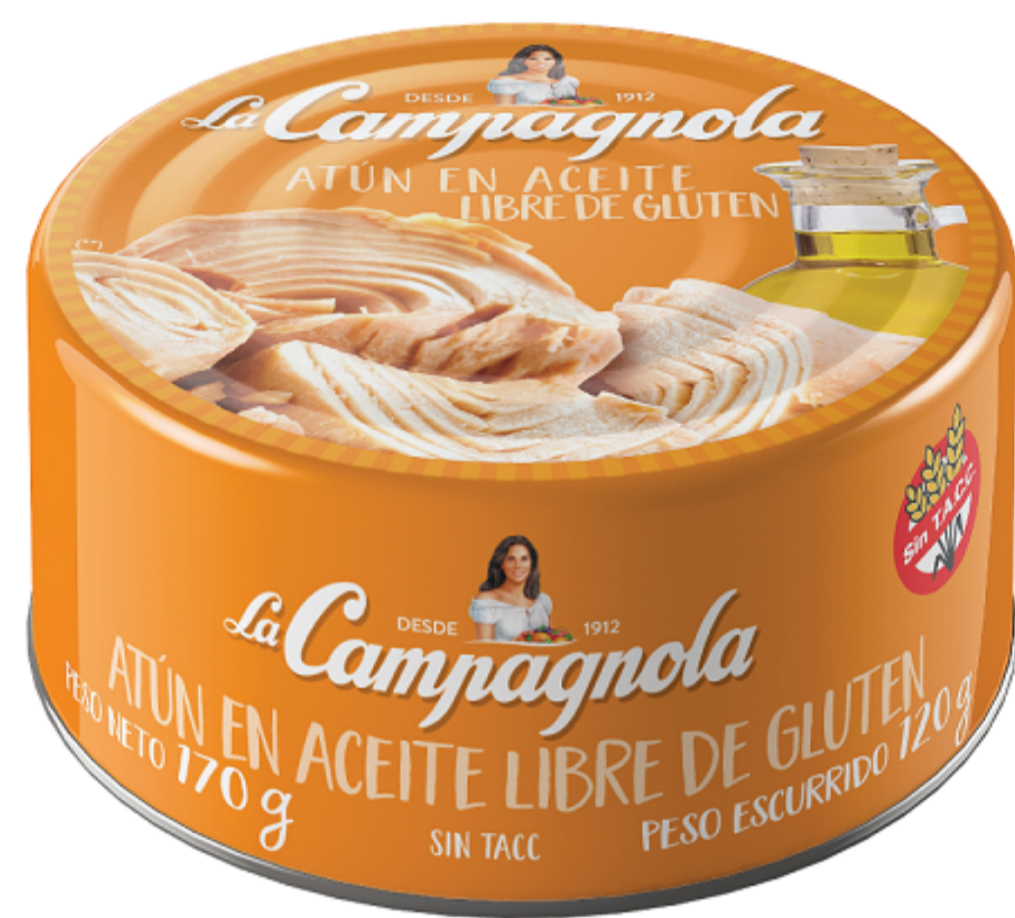
Atún Aceite 170 grs

1000930 ATUN LOMOS EN ACEITE CAMPAGN. 24X170g SIN TACC