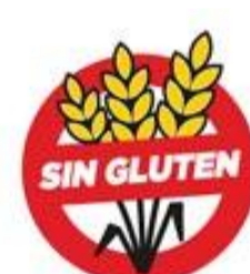
Dulce de Batata ARCOR 500 grs