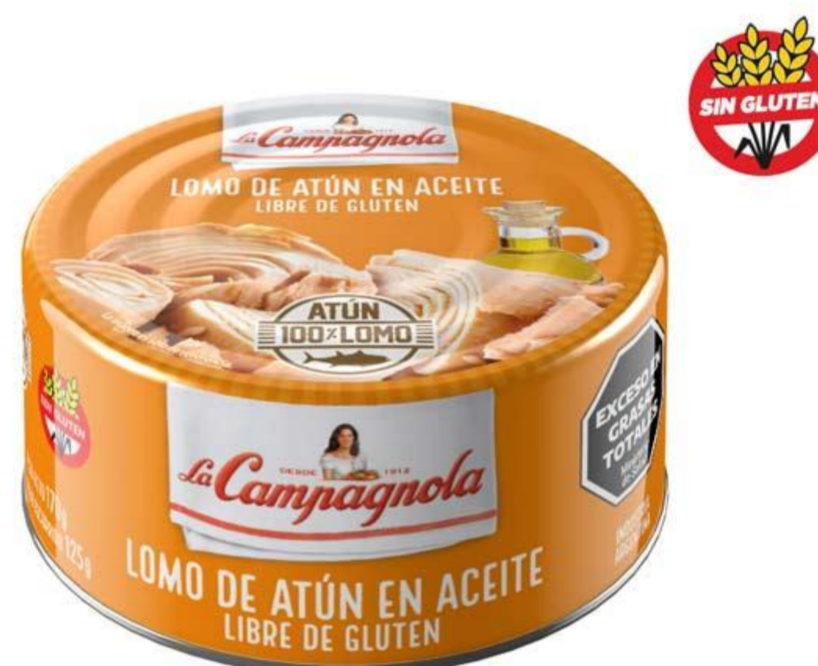
Lomo de Atún en Aceite LA CAMPAGNOLA 170 grs